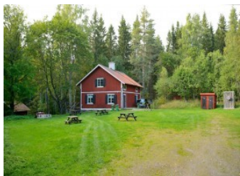
Torpet – vår fin QTH för årets fieldday

I helgen 11-13 September så var det åter dags för SK3GK att hålla sin årliga Field Day. Då stugan vi brukar hålla till i tragiskt nog brann ner till grunden förra året, en vecka efter att vi haft Field Day 2014 så fick vi i år leta efter ett nytt ställe. Som av en händelse har Högbo Äventyrsservice ytterligare en stuga som vi kunde hyra. Den ligger vackert inbäddad i gammal skog och ängsmark.