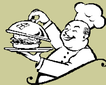
Äta god mat