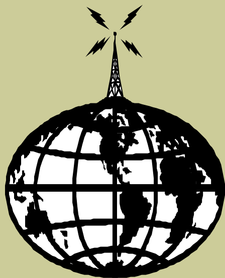
Sätta upp antenner.