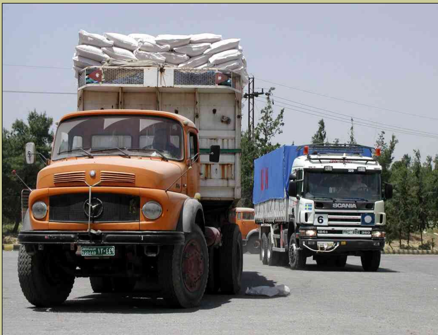
Förnödenheter och utrustning på väg.