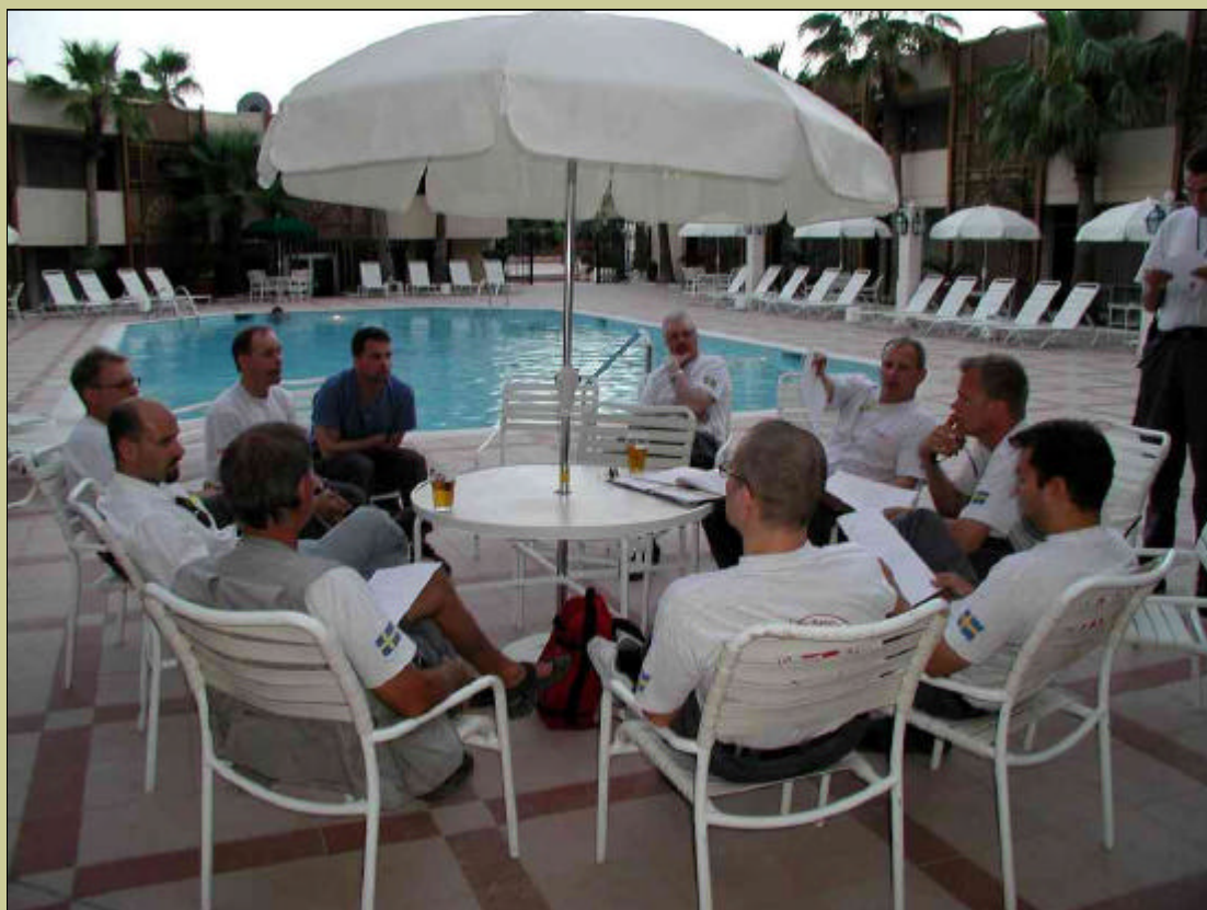
Räddningsverkets personal i Irak har genomgång.