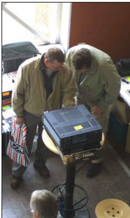
Intresserade radioamatörer tittar på Icoms nya kortvågsrigg, IC-7800. Pris: 92.000 kronor!