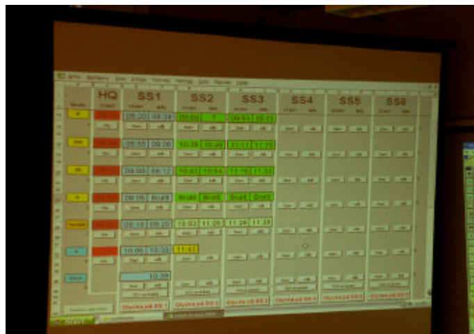
Plottningen av föråkarbilarnas positioner visades på filmduk från en bildprojektor i RescueControll.