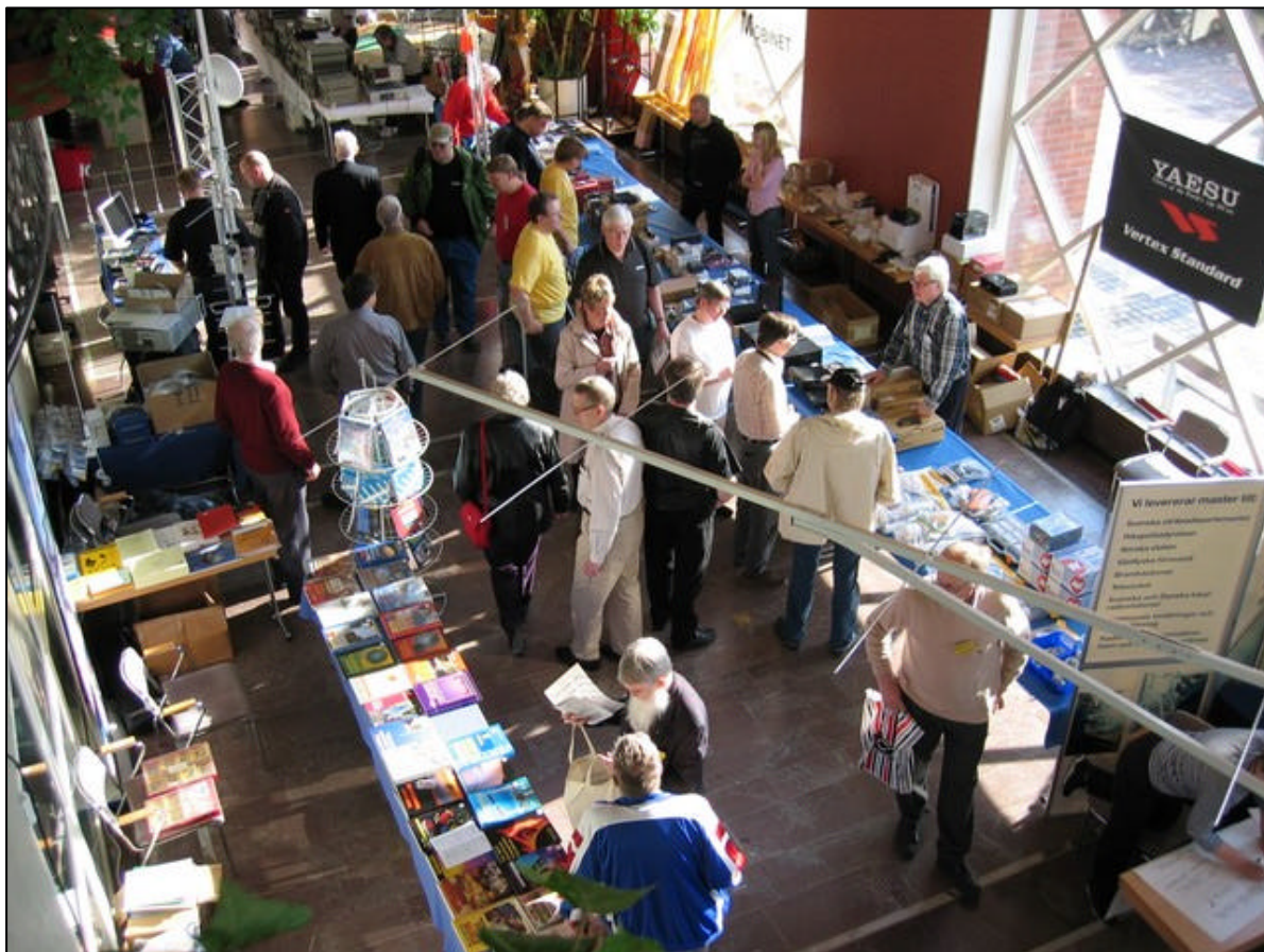
Från årsmötet i Borlänge förra året