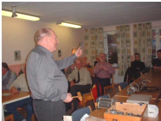
I lokalen har många möten och auktioner ägt rum under årens lopp.