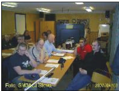
Ett antal muntra radiooperatörer hade kommit till träffen.

Horndals MK tänker ordna sin sedvanliga rallytävling Gränsrallyt lördagen den 15 september. Risk för vackert väder då också.