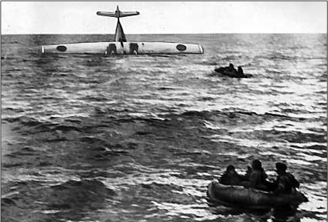
Catalinan sköts ned av ryssarna 1952, men besättningen klarade sig.